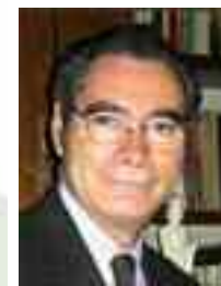
Por: Bernardo Ardavín